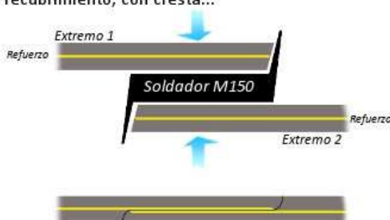
Superposición de los extremos sobre 70mm