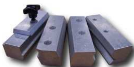
Pares de mordazas