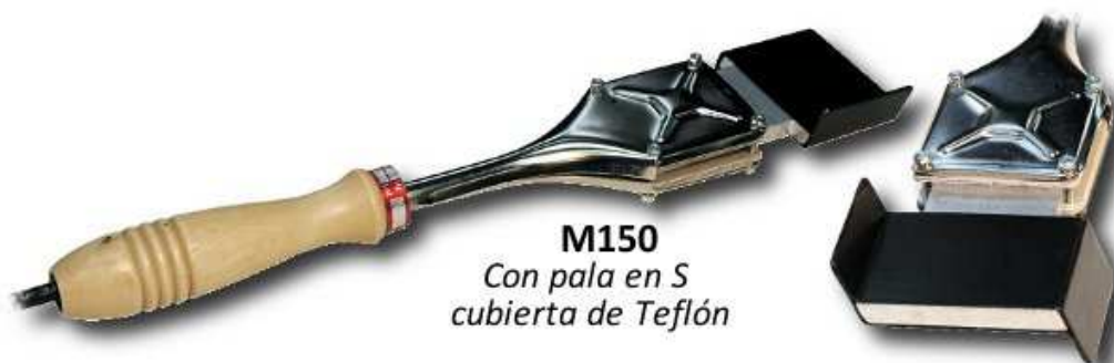
M150 Con pala en S cubierta de Teflón

Incluye : M150, J150, 1 par mordazas, 1 tijera de corte S135.