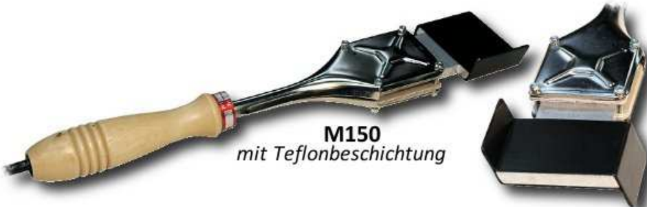
M150 mit Teflonbeschichtung

Enthält : M150, J150, 1 Backenset mit Profil Ihrer Wahl, 1 S135 Schere, 1 doppelseitiges Klebeband.